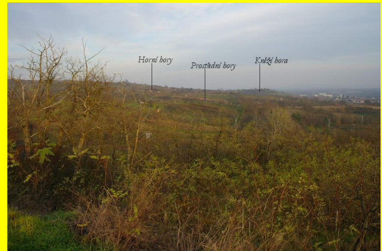
Bzenec („král moravských vín“)

svázání místa (původu) s kvalitou reprezentace místa vyjádřena hierarchickým systémem