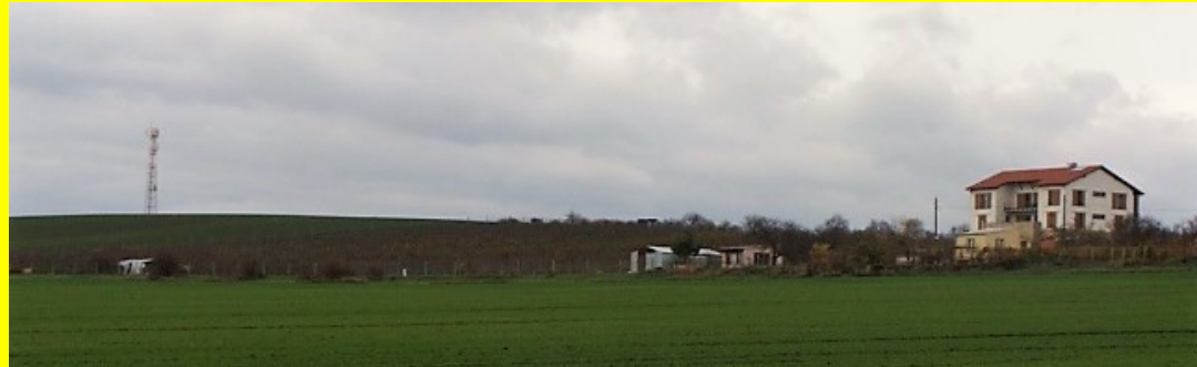
Strachotice (Waldberg- Strachotický vrch)

burgundský climat a berní vinice (v 5ti třídách) x viniční trať (Weinbergsried)